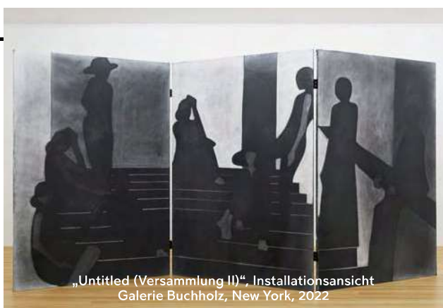
„Untitled (Versammlung II)“, Installationsansicht Galerie Buchholz, New York, 2022

RUTH BAUMGARTE: „AFRICA: VISIONS OF LIGHT AND COLOR“, Albertina, Wien, bis 5. März